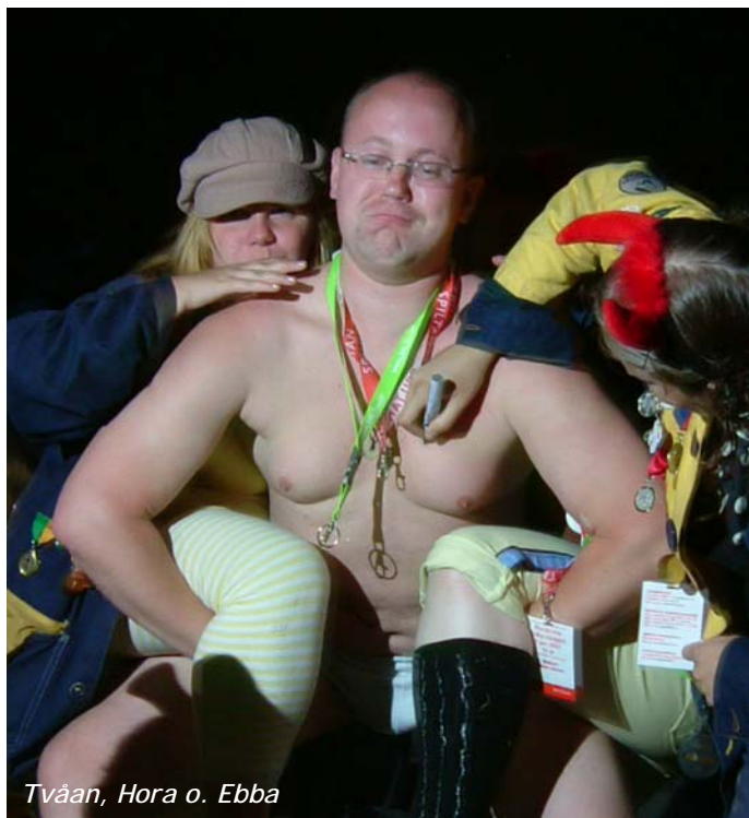
Tvåan, Hora o. Ebba

Vi står med ett spännande år framför oss: gråsmöte i höst, 35-årskonserter till våren och sedan en sommartour för gamlingar. Mer om allt detta kan du läsa i denna sommarupplaga av gråsbulletinen. Vi har skickat