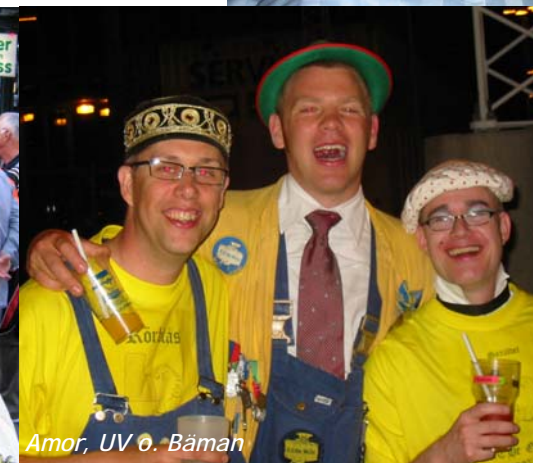
Amor, UV o. Båman