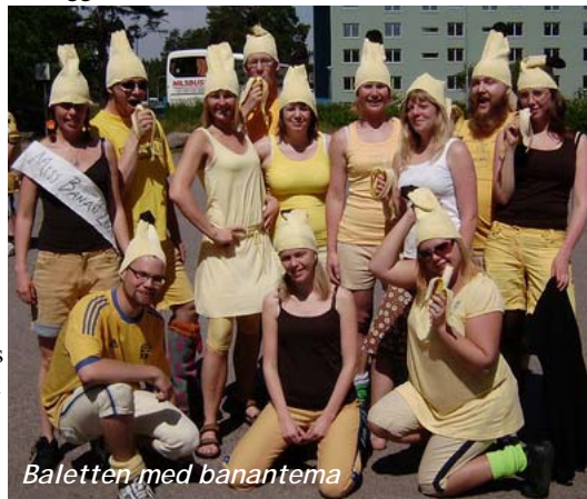
Baletten med bananterna

sektionsrundor i Regensburg - staden som är tätast på pubar. Sektionerna tog sin kväll här och de flesta skrev kort till de färskaste gamlingarna. "Vem är det???" var en ganska vanlig kommentar under skrivandet... Nakenhakki blev ett begrepp, vilket beskrivs närmare på nästa sida.