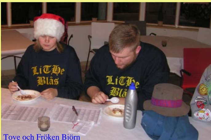
Tove och Fröken Björn

Varje år kring början av december har LiThe Blås sin fantastiska Luciafest. Så kommer att ske även i år fast med en förändring: i år har vi en sittning innan. Vi bjuder in Er, kulturföreningarna och festerierna på universitetet för en urkul sammankomst. Vi bjuder på öl/cider, vin, god julmat och ren underhållning för 300 bagis. Vi ser gärna att så många av er gamlingar kommer och förgyller denna sitt-