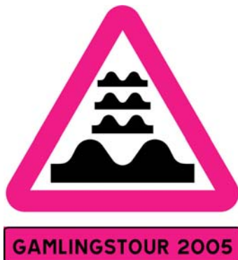
Det snygga tröjtrycket med tuttloggan.

Äntligen var det dags! Gamlingstour 2005 var redo att starta. Förväntansfulla resenärer samlades i Musicum under eftermiddagen. Reseledningens tema för dagen var konst & kultur. I orkestersalen var det vernissage. Det som visades upp var vackra konstverk av rosa piprensare och pärlor som deltagarna hade skapat för att uttrycka sina förväntningar på touren. Dessa konstverk gjordes under tourens kick-off som skedde på SOF-lördagen tidigare på våren. Under vernissagen fick deltagarna leta reda på sina resekit som bl.a. bestod av diverse hygienprodukter, den vackra rosa tourtröjan med årets logga och vykort med valspråket ”fyra nyanser av skärt” i en smidig glassburk.